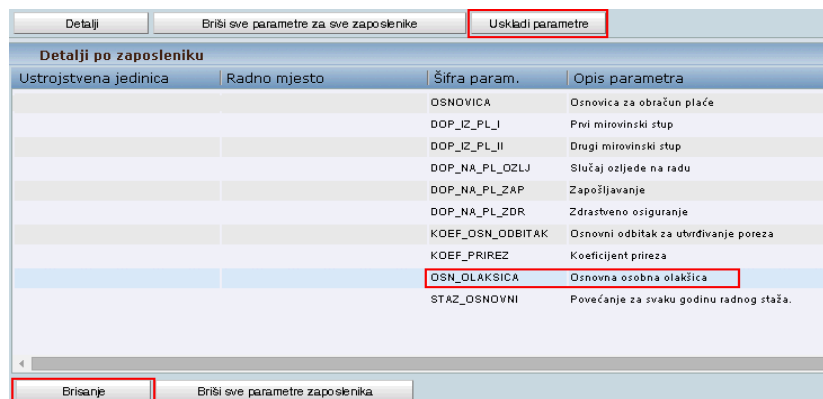
Slika 2. Opcija za uskladu parametara i brisanja parametra koji je suvišan

Obzirom da je Uredbom propisano da zaposlenik osobni odbitak tijekom godine može koristiti samo kod poslodavca kod kojeg se nalazi porezna kartica u trenutku isplate, obavezno je obrisati parametre za olakšice, odnosno osobnih odbitaka koje se u sustavu Registra zaposlenih evidentiraju temeljem PK kartice (porezne kartice).