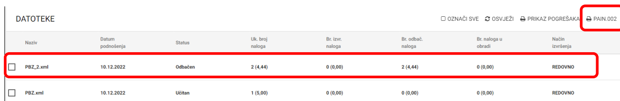
Slika 5. Preuzimanje poruke pain.002

Poruku pain.002 moguće je preuzeti na način opisan na slici 4 i 5: