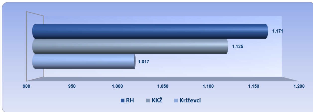
Grafikon 1. Prosječna mjesečna neto plaća zaposlenih kod poduzetnika u Križevcima, KKŽ i RH u 2024. godini (prosječne plaće u eurima)