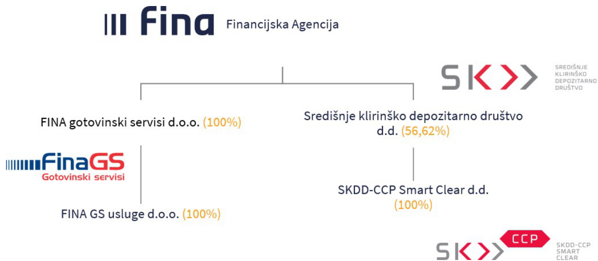
Slika 1. Fina i povezana društva

Fina je osnovana temeljem posebnog propisa i nema vlastitih otkupljenih dionica kao ni podružnica u smislu čl. 24. Zakona o računovodstvu (NN 85/24, 145/24, 151/25)(dalje u tekstu: ZOR). Fina posjeduje 100% udjela u društvu FINA gotovinski servisi d.o.o. i 56,62% dionica u SKDD d.d.